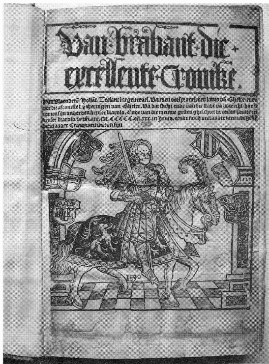
De 'Excellente kroniek van Brabant' (1530), (najaar) in ANTWERPEN.

ROBINSON, Pamela R., Catalogue of Dated and Datable Manuscripts c. 888-1600 in London Libraries . London, British Library, 2003. 2 vols, 118 pp., 306 platen, geb. ISBN 0 7123 4838 7. £ 95.